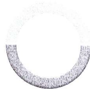
ENLACE GLOBAL PM S/INTERESES (Saldo inicial de $5,544.98)