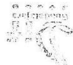
Equipo de Computo, según el siguiente listado anexo.